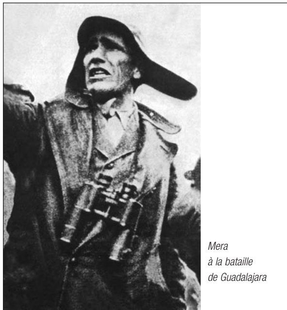
Mera à la bataille de Guadalajara

Il commande alors, avec le grade de lieutenant colonel, le IV e Corps d'Armée et à l'issue de la bataille de Guadalajara défait les troupes italiennes envoyées par Mussolini.