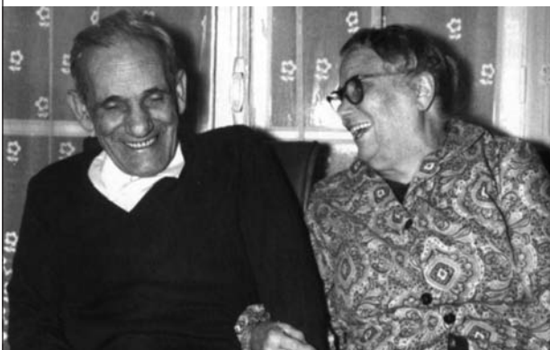
Cipriano Mera en exil à Paris.

C'est alors que la guerre civile prend le pas sur la révolution et les milices sont militarisées, Cipriano Mera accepte difficilement cette transformation. Sans accepter réellement ce tournant politique, il y voit néanmoins un moyen de sauver des vies et de rendre les affrontements militaires plus efficaces.